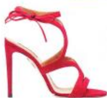
Замшевые босоножки, Aquazzura, 43 000 руб., Aquazzura