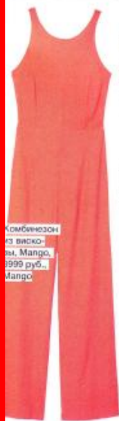
Комбинезон из вискозы, Mango, 3999 руб., Mango