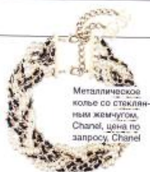
Металлическое кольцо со стеклянным жемчугом, Chanel, цена по запросу, Chanel