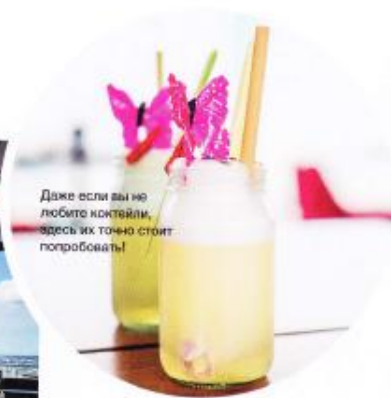
Даже если вы не любите коктейли, здесь их точно стоит попробовать!

сделать это – вместе с гидом Streetwise Gugu. Он покажет настоящий город и излюбленные уголки местных жителей. И это еще не все, что нужно успеть сделать в Бангкоке. Попейте кофе в Iwane 1975, устроившись прямо на полу. Поужинайте в индийском ресторане Charcoal Tandoor Grill & Mixology с бассейном, где собираются сливки тамошнего общества. Прогуляйтесь в парке «Люмпини» и попрактикуйте цигун или оцените по достоинству архитектурно-ландшафтный дизайн в парке Рамы IX. Сколько бы дней у вас ни было, вам не хватит – и это мы еще про шопинг не упоминали. Придется возвращаться! ☹