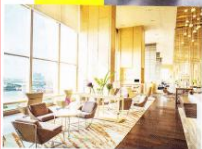
Любоваться урбанистическим пейзажем можно даже из лобби отеля, расположенного на 6-м этаже здания

сделать это – вместе с гидом Streetwise Gugu. Он покажет настоящий город и излюбленные уголки местных жителей. И это еще не все, что нужно успеть сделать в Бангкоке. Попейте кофе в Iwane 1975, устроившись прямо на полу. Поужинайте в индийском ресторане Charcoal Tandoor Grill & Mixology с бассейном, где собираются сливки тамошнего общества. Прогуляйтесь в парке «Люмпини» и попрактикуйте цигун или оцените по достоинству архитектурно-ландшафтный дизайн в парке Рамы IX. Сколько бы дней у вас ни было, вам не хватит – и это мы еще про шопинг не упоминали. Придется возвращаться! ☹