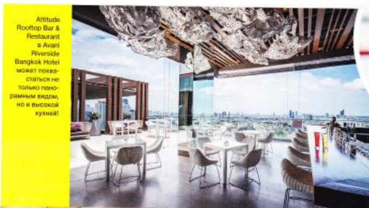
Attitude Rooftop Bar & Restaurant в Avani Riverside Bangkok Hotel может похвастаться не только панорамным видом, но и высокой кухней!