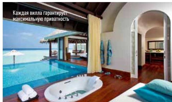
Каждая вилла гарантирует максимальную приватность

Курорт Anantara Kihavah Villas, расположенный в южной части атолла Мале, предлагает акцию для тех, кто хотел бы задержаться на Мальдивах подольше. Каждому посетителю отеля, забронировавшему номер на 8 ночей, еще две ночи предоставляются в подарок. Anantara Kihavah Villas — молодой курорт, основанный в 2011 году. Этот райский уголок расположен в уединенном месте в 134 км от аэропорта Мале. Медитативный отдых сопровождается яркими гастрономическими впечатлениями. На территории курорта — сразу несколько ресторанов, достойных самого пристального внимания. Главная здешняя кулинарная достопримечательность — проект Sea, настоящий подводный ресторан, в котором предлагается высокая авторская кухня и собрана внушительная коллекция лучших вин мира. Также стоит побывать в Salt (изумительная паназиатская кухня), где к каждому блюду сервируется особый вид соли, а также посетить Fire — тепаньяки-ресторан, в котором гости становятся