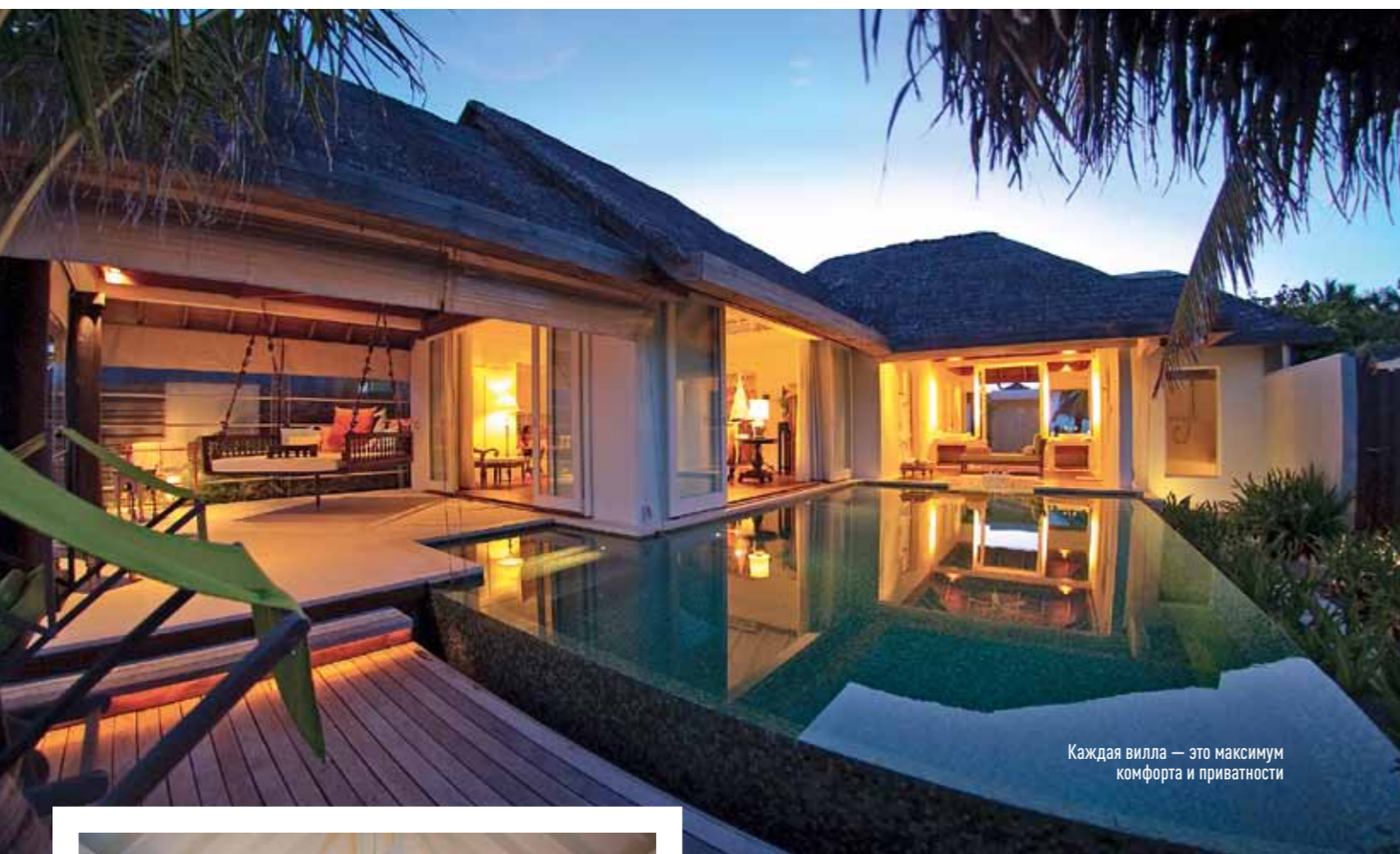
Каждая вилла — это максимум комфорта и приватности